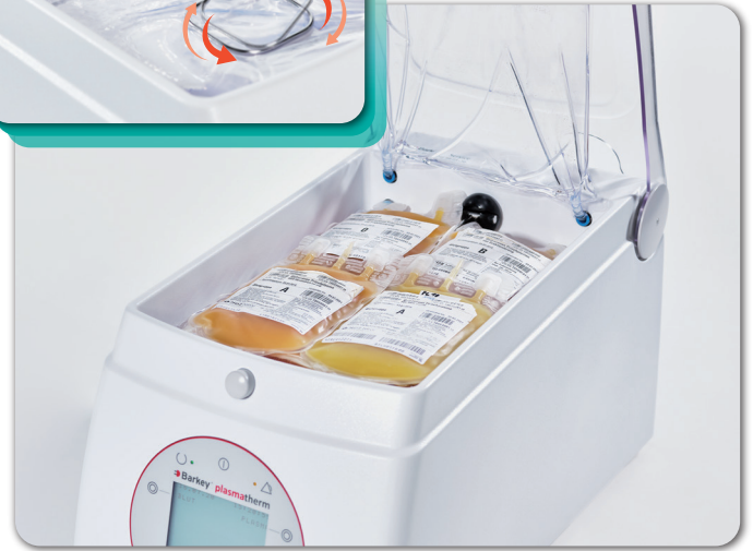
※画像はFFP240mlを融解する場合のイメージです。