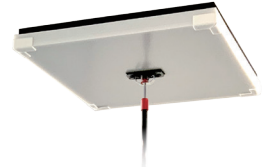
室内カバー対応部: 換気口